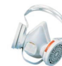
Exemple de modèle A2P2

Porter impérativement le masque lors des opérations de nettoyage.